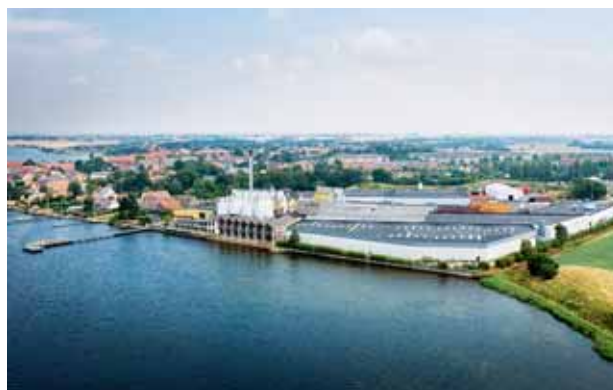
Harboes Bryggeri, Skælskør

Darguner Brauerei GmbH's introduktion af øl i plastikflasker gav nye afsætningsmæssige muligheder på det tyske marked, hvor salget af dåseøl samtidig blev minimeret.