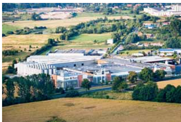
Darguner Brauerei, Dargun